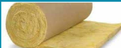
Laine de verre