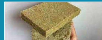
Laine de roche