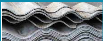
Déchets d' Amiantes