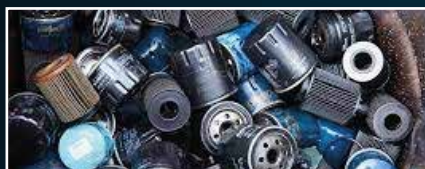
Filtres à huiles