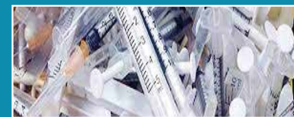
Déchets d'activités de soins