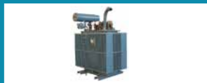
Déchets de PCB