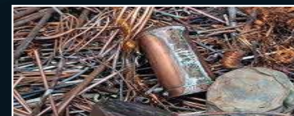
Déchets non ferreux