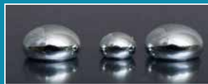
Déchets de mercure