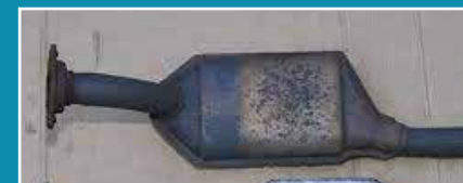
Déchets des catalyseurs