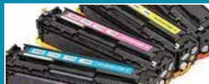
Déchet des toners