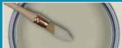
Peintures, colles, mastic