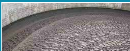
Boues, sols et terres contaminées